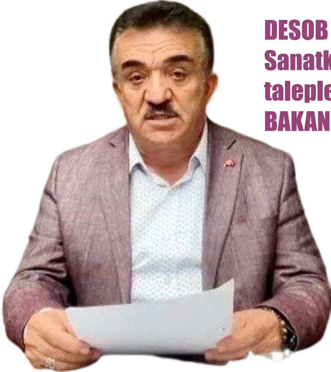
Mustafa Kayıkcı/DESOB Başkanı